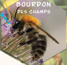
BOURDON DES CHAMPS

JE NICHE SOUVENT AU RAS DU SOL OU DANS D'ANCIENS NIDS D'OISEAUX