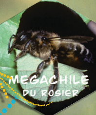
MEGACHILE DU ROSIER